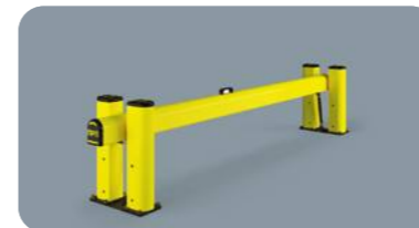
DOCK GATE L 2400-2500