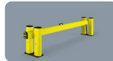
DOCK GATE XL 2500-3000